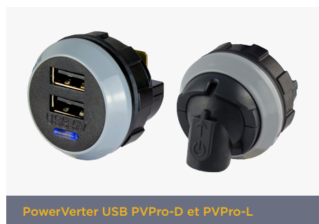
PowerVerter USB PVPro-D et PVPro-L

Obtenir un éclairage ambiant correct dans les autobus et les autocars en conduisant la nuit peut être un défi. Certains passagers peuvent souhaiter se reposer, d'autres lire, vérifier et mettre à jour leurs appareils mobiles. Cela cause le dilemme: allumer ou éteindre? La nuit, les lumières sont généralement tamisées et les passagers peuvent choisir une lampe de lecture privée, éclairant leur environnement, généralement située dans le plafond du véhicule. Cependant, pour atteindre du plafond, ces éclairages doivent être assez lumineux. Cela peut gêner les passagers à proximité, ainsi qu'une distraction importante de la vue arrière pour le conducteur lorsque les feux clignotent.