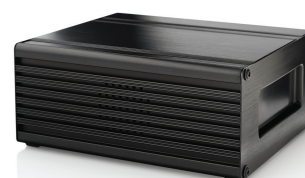
Funkgerät + Alfatronix Basisstation Netzgerät + Alfatronix Battery Back-Up Box