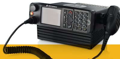
Motorola MTM800 TETRA