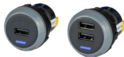
PowerVerter PV65R-S et PV65R-D sortie simple et double.